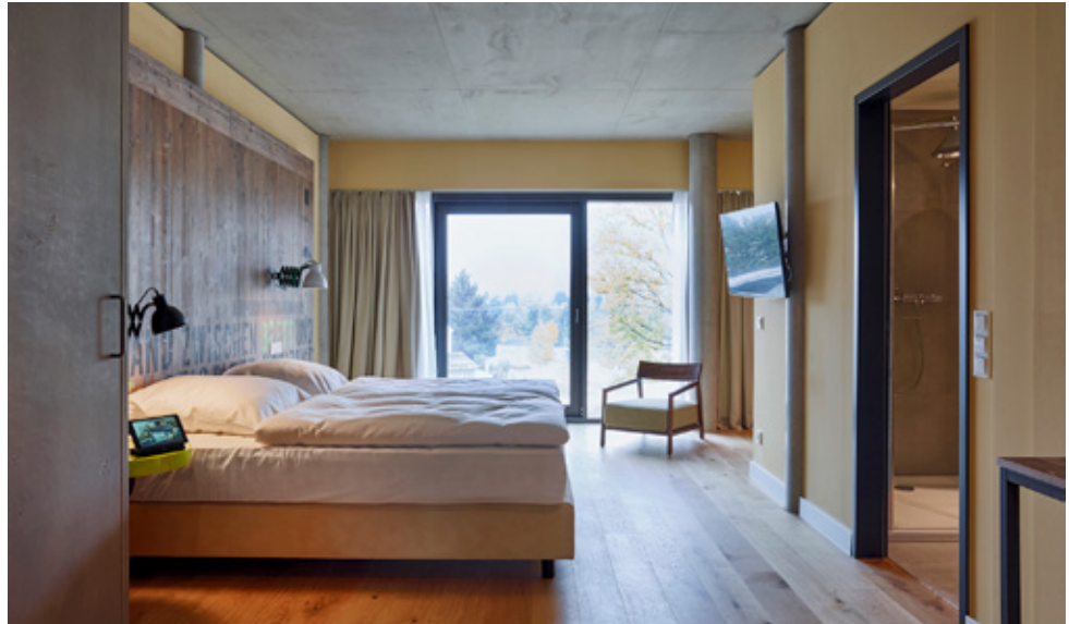
Der naturbelassene Farbton der HARO Landhausdielen ist ein charakterstarker Blickfang in den Zimmern mit der reduzierten Einrichtung.

Das Hotel FREIgeist ist ein Ort, an dem man das Leben einmal querdenken kann. Das ist das Motto des neuen Hotels – hier darf